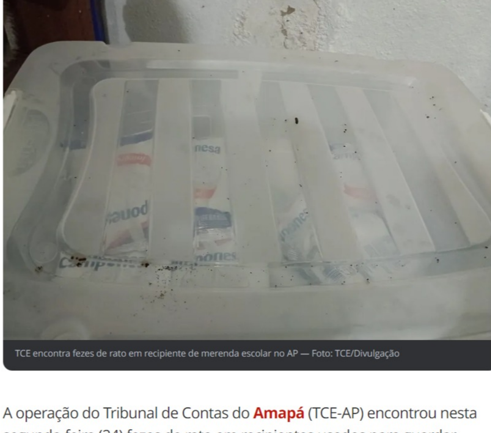
TCE encontra fezes de rato em recipiente de merenda escolar no AP

A operação do Tribunal de Contas do Amapá (TCE-AP) encontrou nesta segunda-feira (24) fezes de rato em recipientes usados para guardar alimentos em uma escola no Amapá . Também foi vistoriada a condição de estruturas de escolas nos municípios de Macapá e Santana.