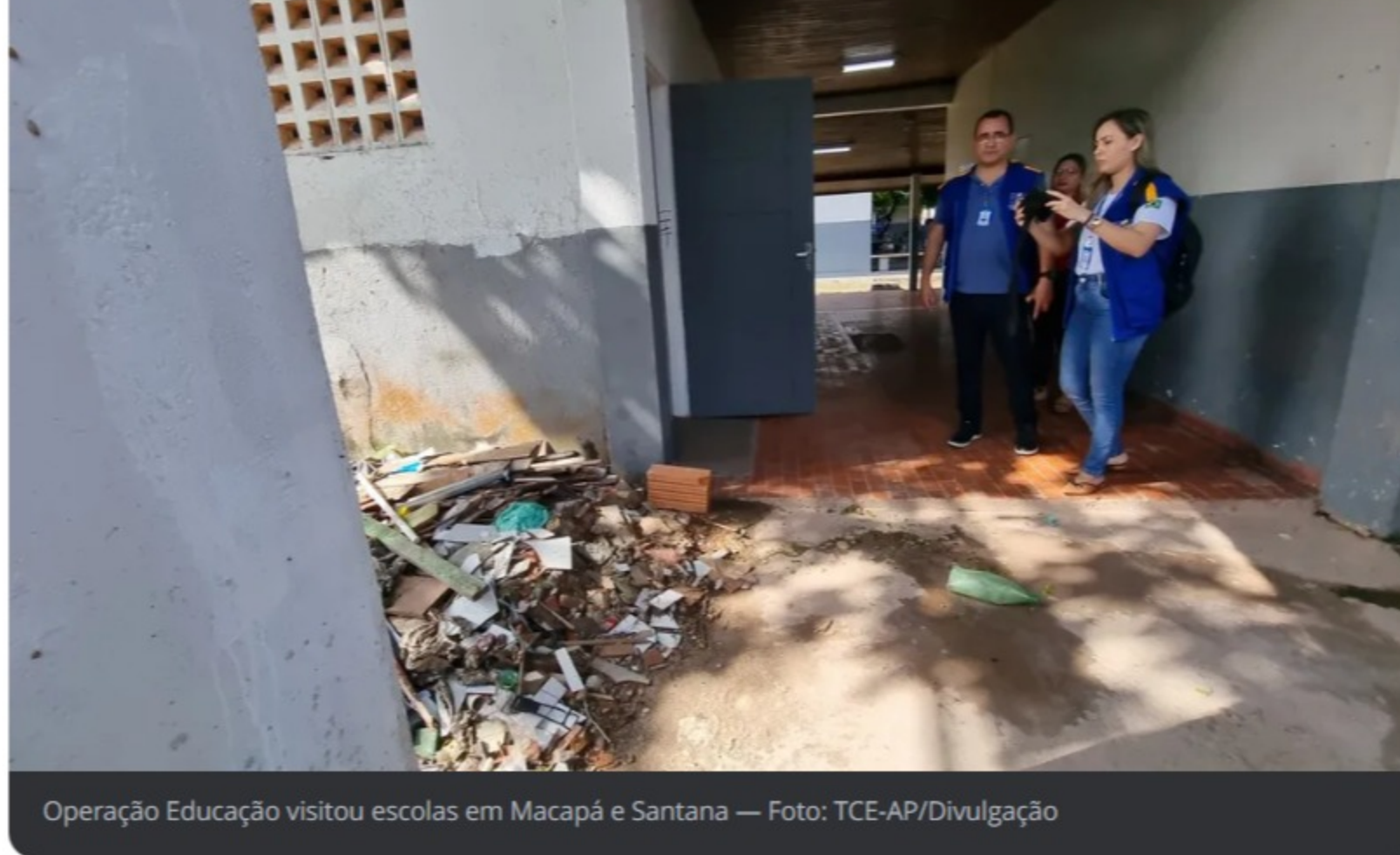
Operação Educação visitou escolas em Macapá e Santana

As instituições estaduais e municipais foram selecionadas a partir de indicadores sobre as condições da infraestrutura que constam no Censo Escolar de 2022.