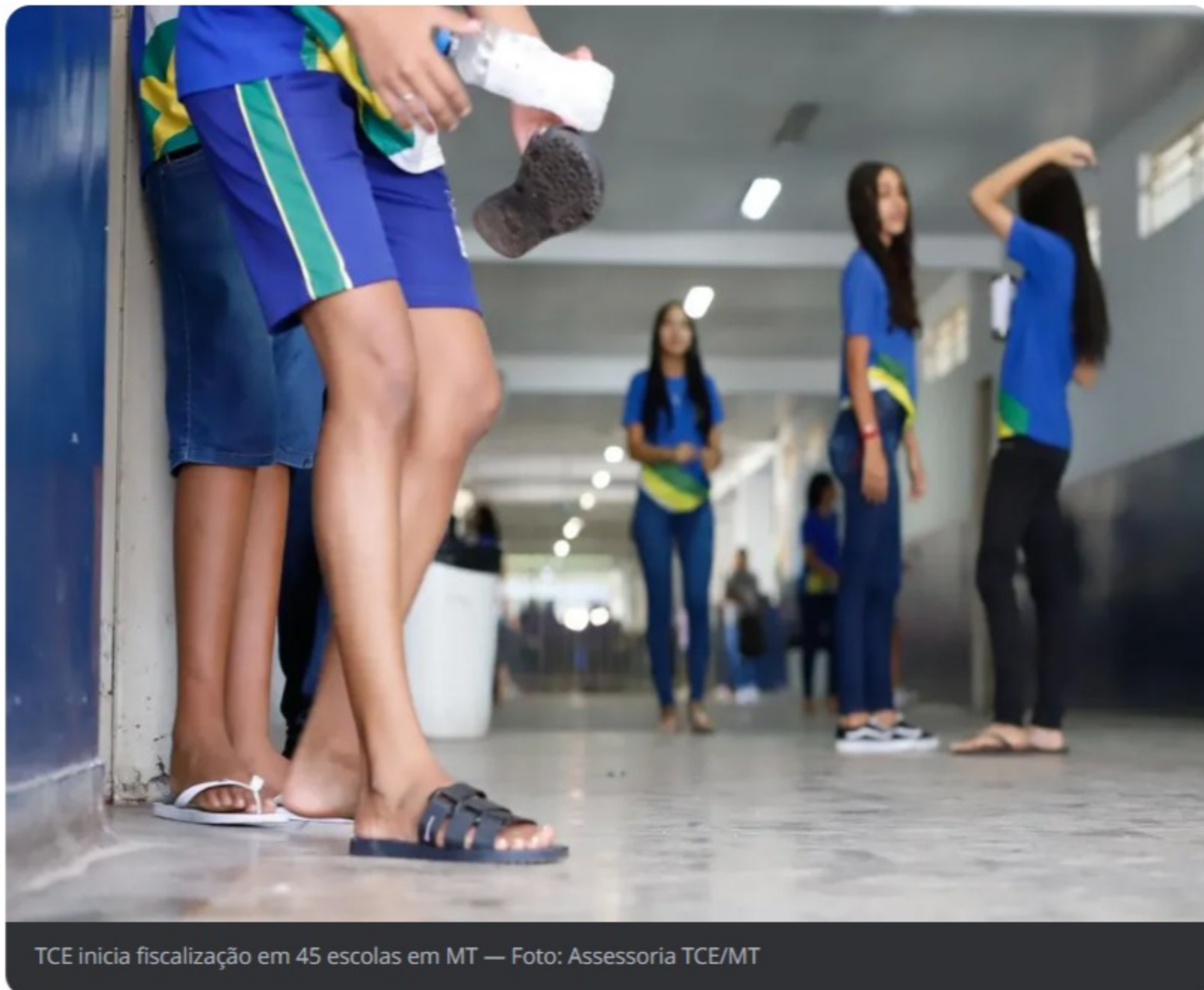
TCE inicia fiscalização em 45 escolas em MT

Os técnicos verificaram a acessibilidade, estrutura e conservação da edificação, saneamento básico e energia elétrica, sistema de combate à incêndio, alimentação, esporte, recreação e espaços pedagógicos.