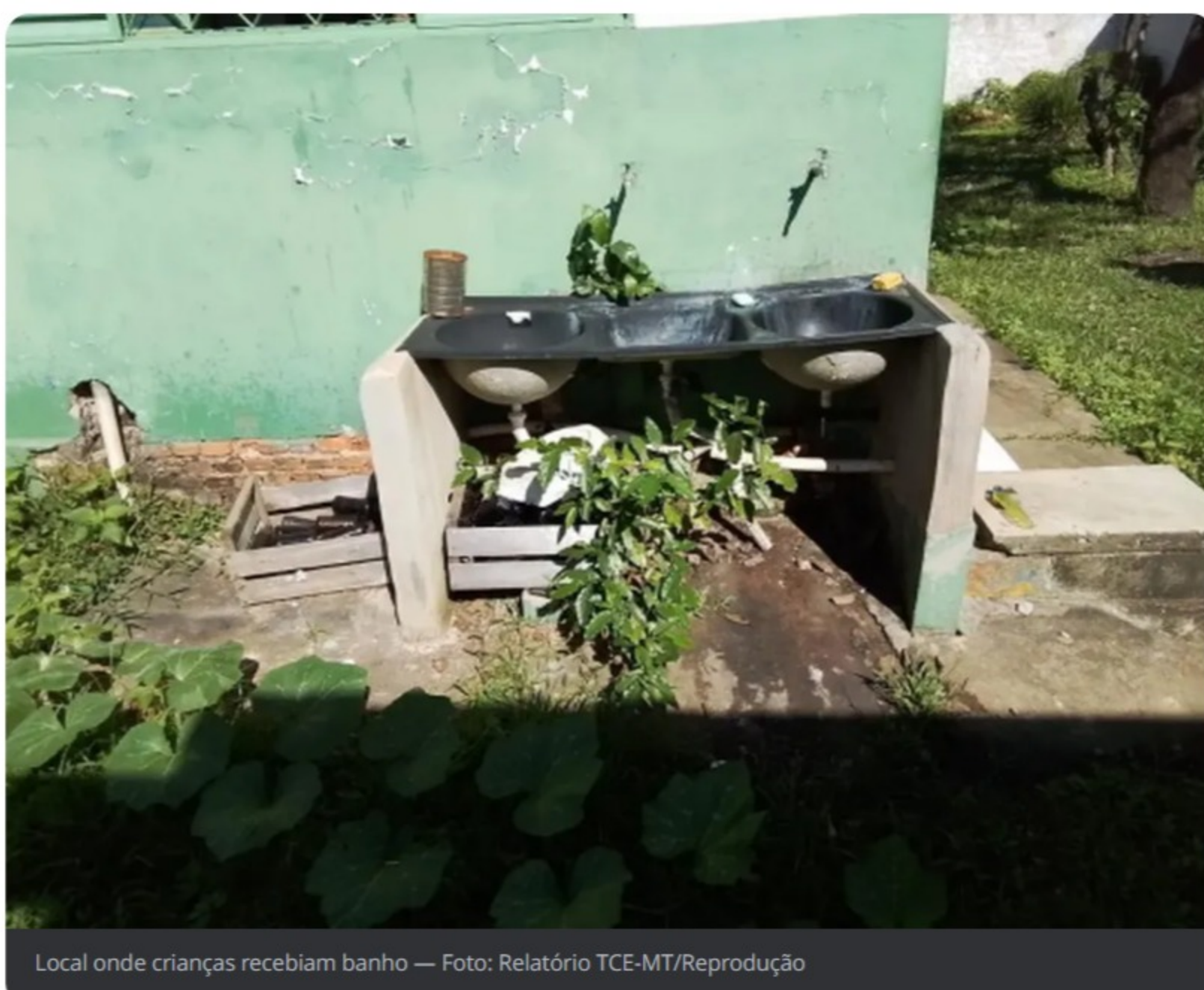
Local onde crianças recebiam banho — Foto: Relatório TCE-MT/Reprodução

Outros problemas também chamaram atenção dos auditores, como indícios de vandalismo, pichações, mato alto no terreno da escola e itens de material de construção espalhados pelo parquinho.