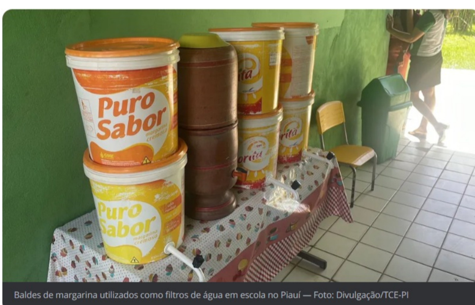
Baldes de margarina utilizados como filtros de água em escola no Piauí

A chefe da Divisão de Fiscalização da Educação do TCE Piauí, Carolline Leite, informou que a escola não tem água encanada, que os recipientes filtravam a água fornecida por uma fonte na região e que depois a água era refrigerada e disponibilizada para os alunos.