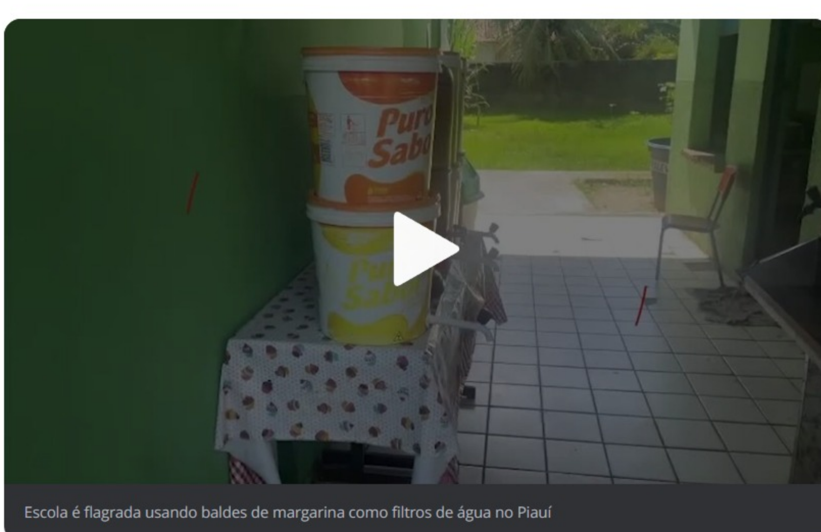
Escola é flagrada usando baldes de margarina como filtros de água no Piauí

A Unidade Escolar Domingos Alves Pereira, escola municipal em Matias Olímpio , 237 km ao Norte de Teresina, foi flagrada utilizando baldes de margarina como filtros de água durante fiscalização da Operação Educação, realizada pelo Tribunal de Contas do Estado do Piauí (TCE-PI) entre 24 e 26 de abril.