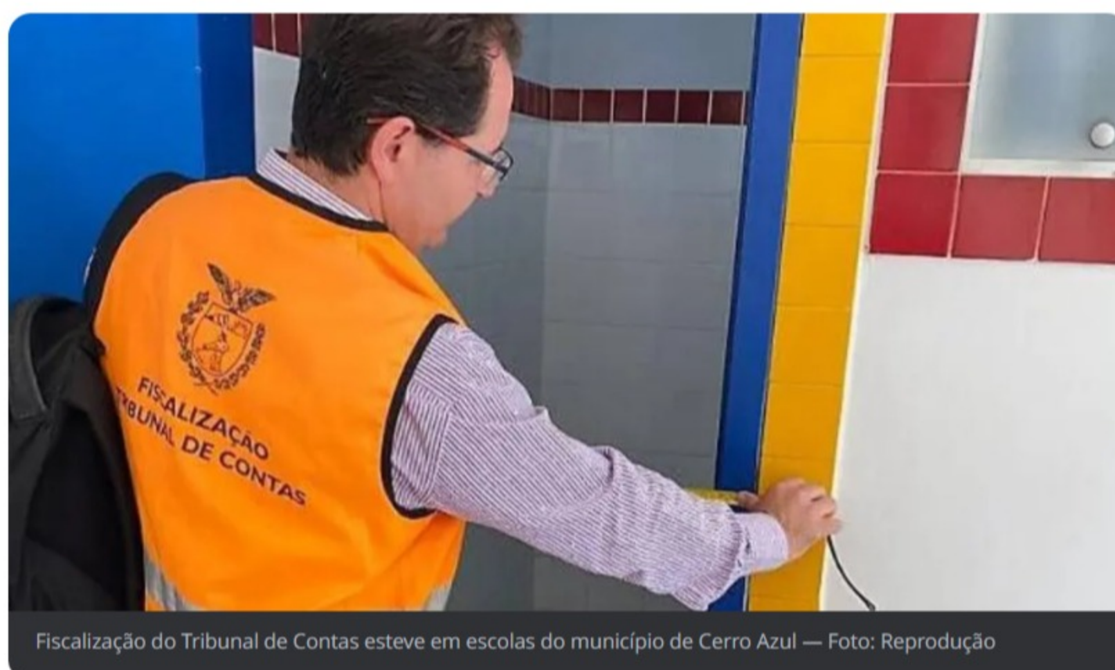
Fiscalização do Tribunal de Contas esteve em escolas do município de Cerro Azul

O Tribunal de Contas do Paraná (TCE-PR) concluiu nesta quinta-feira (27) a vistoria em quatro escolas municipais de Cerro Azul , na Região Metropolitana de Curitiba (RMC). A ação integrou a Operação Educação, auditoria nacional que verifica as condições de infraestrutura de escolas municipais.