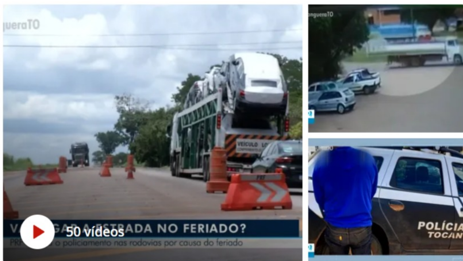
50 vídeos: O que aconteceu na estrada no feriado?

Veja mais notícias da região no g1 Tocantins .