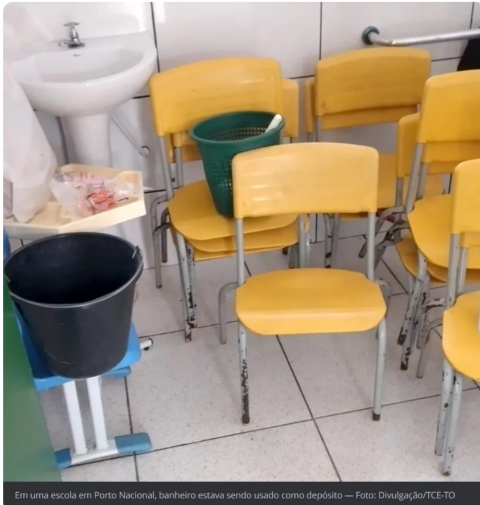
Em uma escola em Porto Nacional, banheiro estava sendo usado como depósito

Algumas das condições encontradas foram geladeira sem higiene e em péssimas condições de armazenamento; sala de aula com infiltração; botijão de gás dentro da cozinha e com armários estrutura precária; banheiro único para meninas e meninos em escola rural; sala de aula sem ventilar e com iluminação inadequada, entre outros problemas.