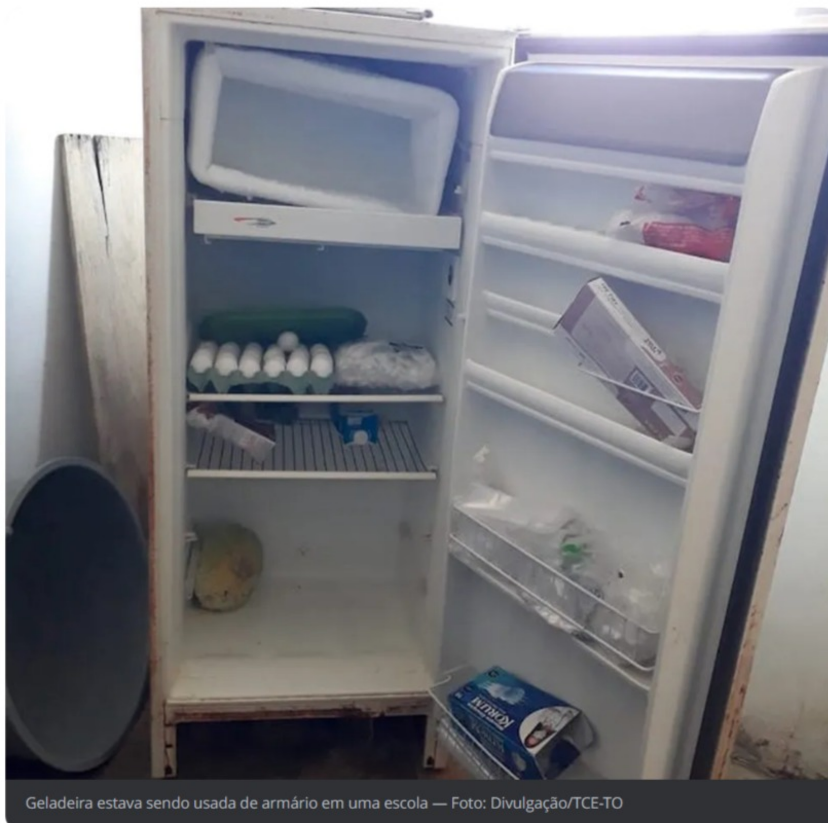
Geladeira estava sendo usada de armário em uma escola

No Tocantins, o órgão visitou escolas de educação infantil. “Em razão das prioridades elegidas para esse exercício, o TCE/TO focou na primeira infância”, destacou o auditor e diretor-geral de Controle Externo do TCE/TO, Dênis Araújo. A definição das escolas escolhidas é baseada em indicadores de criticidade quanto à infraestrutura que constam no Censo Escolar 2022.