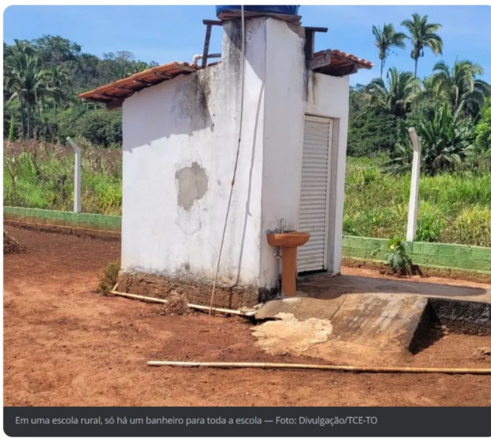
Em uma escola rural, só há um banheiro para toda a escola

O TCE/TO está elaborando relatórios dessas avaliações, que vão ser submetidos à consolidação nacional, sob responsabilidade do TCE/SP. A partir dessa coleta de dados, o Tribunal de Contas da União vai propor, internamente, formas de resolver os problemas identificados durante as fiscalizações.