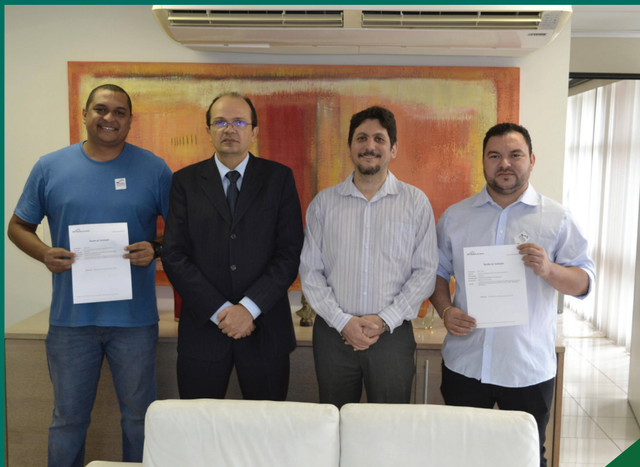
PROATIVIDADE: contadores dos municípios de Belágua e Carutapera durante entrega de suas contas

Para o presidente do TCE, conselheiro Caldas Furtado, o sucesso do novo formato já em sua estreia é um sinal de que a mensagem do Tribunal está sendo bem assimilada pelos gestores, que cada vez mais se preparam para um novo relacionamento com o órgão, baseado no diálogo e no acompanhamento permanente da execução orçamentária, por meio de sistemas eletrônicos. “Esse é o futuro do controle externo e vemos com satisfação os municípios se estruturando para isso”, destaca. ep