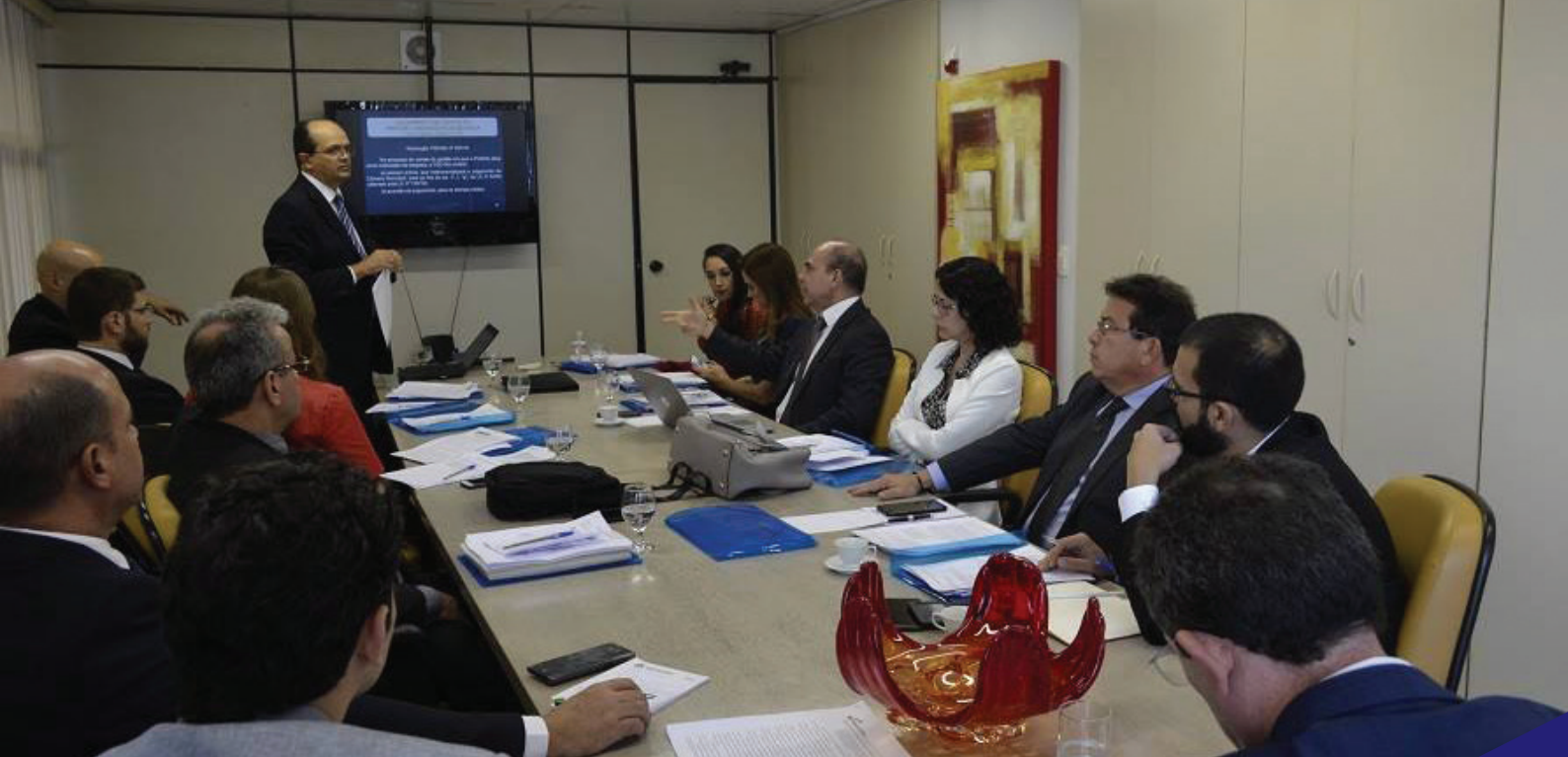
EXPOSIÇÃO do presidente do TCE-MA, conselheiro Caldas Furtado, coordenador do grupo de trabalho que discutiu o tema do prefeito ordenador de despesa

ORDENADORES DE DESPESAS – A segunda reunião realizada na sede do TCE maranhense foi a do grupo de trabalho designado para definir que medidas devem ser adotadas pelos tribunais de contas nos casos de julgamentos das prestações de contas dos prefeitos ordenadores de despesas.