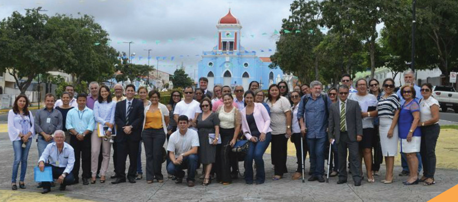
AUDITORES, gestores e profissionais das áreas de Saúde e Educação do município de São José de Ribamar após reunião de validação no município

No campo relativo a essa dimensão, são informadas todas as ações promovidas ou estimuladas pelos municípios para fomentar a evolução dos territórios a partir da identificação das potencialidades produtivas locais, por área e potencial de mercado; mecanismos de incentivo à qualificação e desenvolvimento de habilidades produtivas e gerenciais; estratégias de financiamento aos produtores locais, entre outras ações.