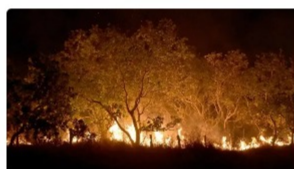
Roraima tem 45% do total de focos de queimadas do país em fevereiro, diz Inpe

A reconstrução do CadÚnico — porta de entrada para mais de 30 programas sociais do governo — é uma das agendas prioritárias do ministério. A pasta assinou em 2023 acordo com a Defensoria Pública da União (DPU) e a Advocacia Geral da União (AGU) para a reestruturação do sistema.