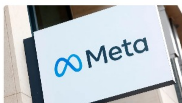
Justiça de SP proíbe Meta de usar marca no Brasil após pedido de empresa homônima