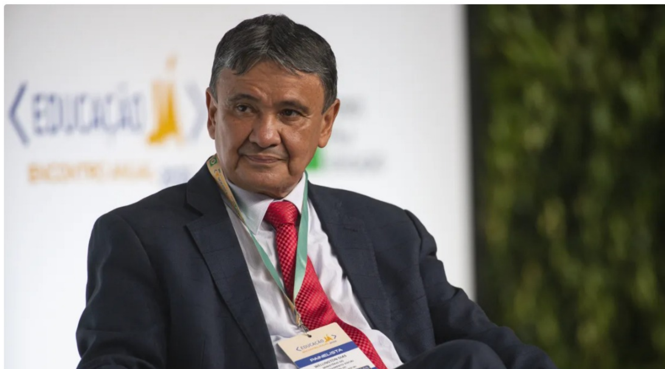
Wellington Dias, ministro do Desenvolvimento Social

Em meio ao desafio de zerar o déficit primário, governo vê a avaliação de gastos também como um caminho para economizar recursos