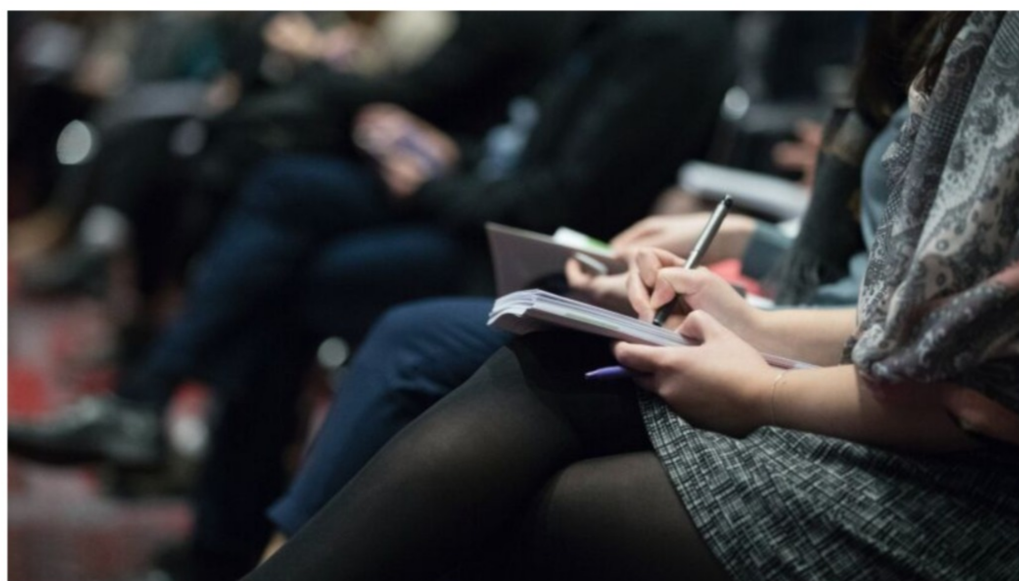
Encontro deve reunir cerca de 1,5 mil pessoas

O 9º Encontro Nacional dos Tribunais de Contas começa na próxima segunda-feira (11/11), em Foz do Iguaçu, no Paraná. O evento vai reunir os ministros do Supremo Tribunal Federal (STF), Dias Toffoli e Luiz Fux, além dos ministros do Tribunal de Contas da União (TCU), Bruno Dantas, Benjamin Zymler e Antonio Anastasia.