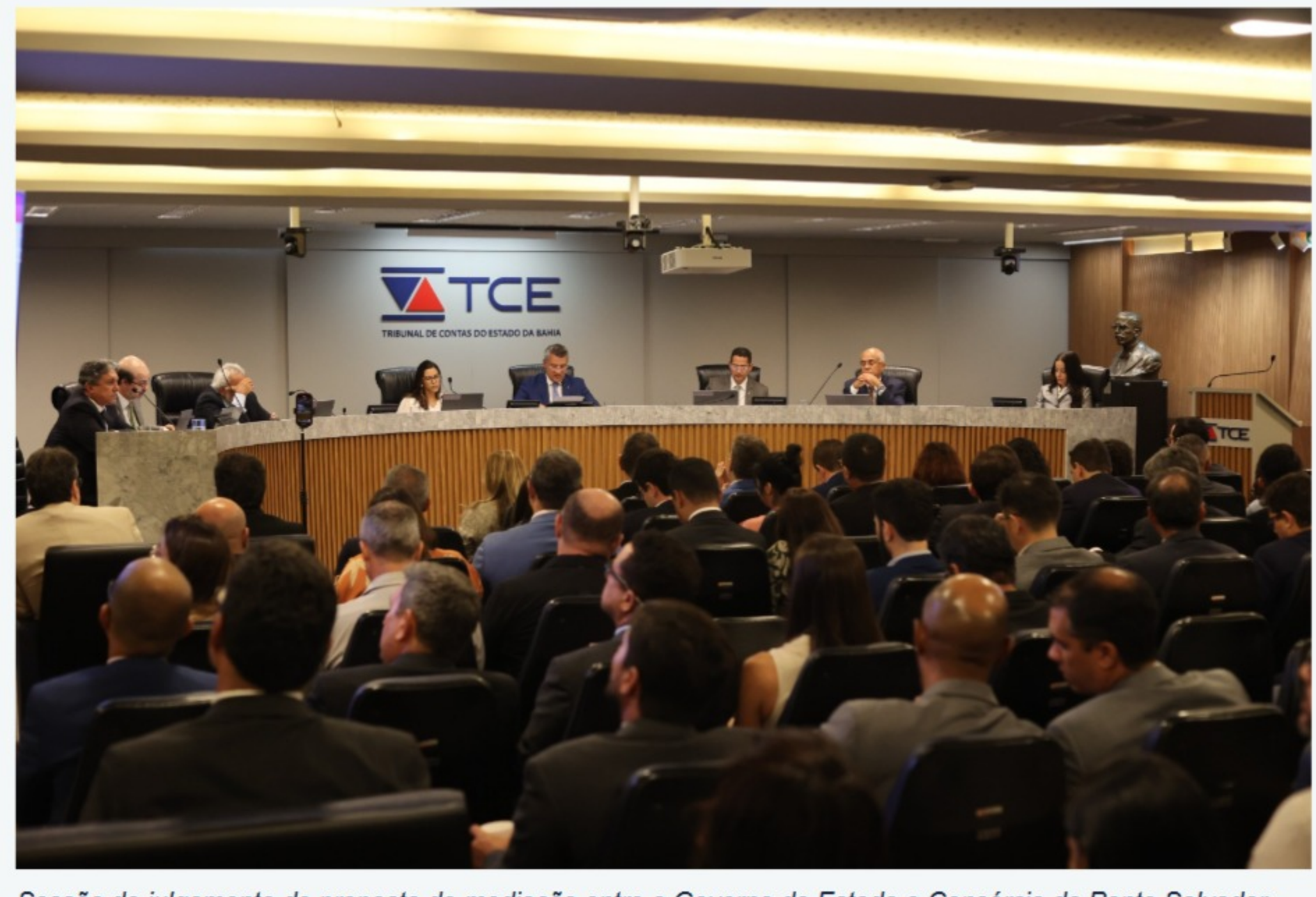
Sessão de julgamento de proposta de mediação entre o Governo do Estado e Consórcio da Ponte Salvador-Itaparica aconteceu nesta terça-feira (11), no TCE

Uma proposta de mediação para sanar os impasses entre o Governo do Estado e a concessionária responsável pela construção da Ponte Salvador-Itaparica foi aprovada com unanimidade pelo Tribunal de Contas do Estado (TCE-BA), no final da tarde desta terça-feira (11). O projeto, que foi elaborado por uma Comissão de Consensualismo, atualiza os termos da licitação e estabelece que a obra deve custar, inicialmente, em torno de R$ 10,4 bilhões, sendo R$ 5,07 bilhões de recursos públicos. Originalmente, o contrato previa R$ 6,3 bilhões para construção do sistema viário, sendo R$ 1,5 bilhão de recursos públicos.